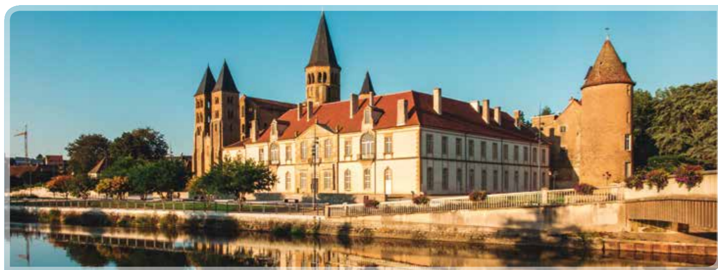
Paray Le Monial (Francia)